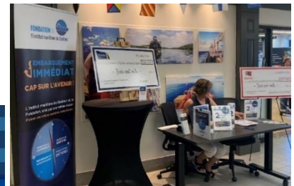
Kiosque d'accueil à l'entrée principale de l'IMQ – « L'Arrivée à bon port » – du 22 au 24 août 2023